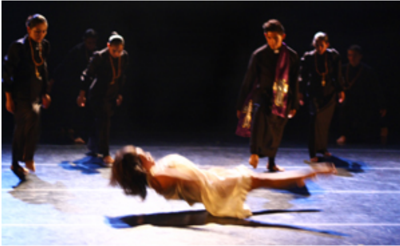
"CAMINO DE FE"

Adicionalmente a la fuerza dramática proyectada en la coreografía de gran formato de la autora-estudia