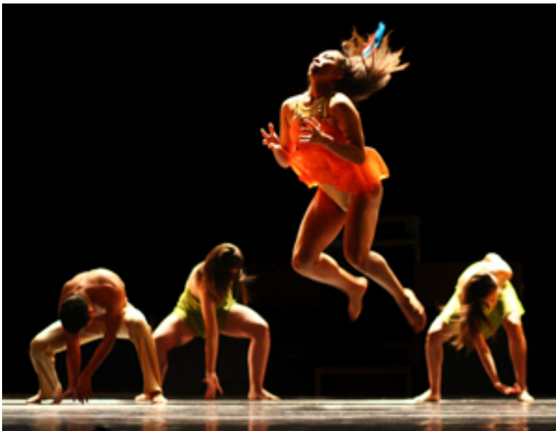
"LA CONSAGRACIÓN DE LA PRIMAVERA"

Adicionalmente a la fuerza dramática proyectada en la coreografía de gran formato de la autora-estudia